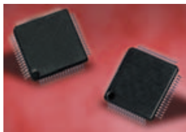
Puce contrôleur COACH III