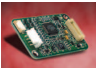
Carte contrôleur Série et USB 2216